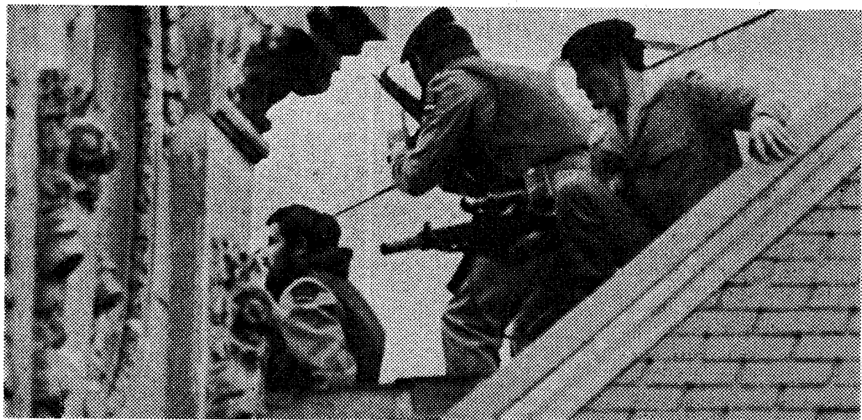
La arriesgada, heroica y afortunada intervención de los GEO queda de alguna manera sintetizada en esta imagen