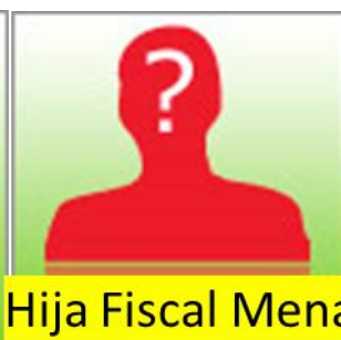
Hija Fiscal Mena