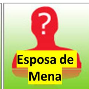
Esposa de Mena