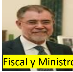
Mar. Fernández Bermejo 12.000.000 $

Aunque se tratase del mismo dinero que entra y sale al juego del gato y el ratón, no deja de ser sumamente grave este tejemaneje por estos líderes de la democracia.